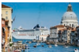
Venedig_Simon.jpg Venedig