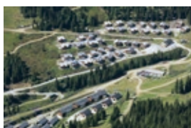
ChaletsLachtal_Bogensberger.jpg Chalets, Lachtal, Steiermark