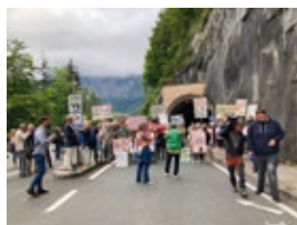
Hallstatt_Idam.jpg Hallstatt, Sommer 2023