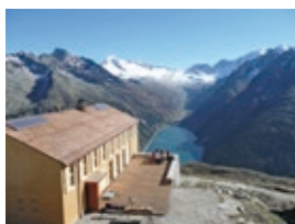
Olpererhuette_Kaufmann.jpg Olpererhütte, Ginzling