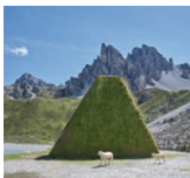
AxamerLizum_Wett.jpg Schuttdamm und Speichersee, Axamer Lizum

Weitere Pressefotos finden Sie auf der Website des Architekturzentrum Wien https://www.azw.at/de/artikel/presse/ueber-tourismus/