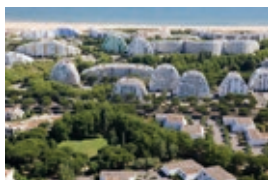
LaGrandeMotte_Baudot.jpg La Grande-Motte, Frankreich