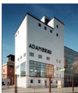
Adambräu_aussen@Schaller.jpg Außenansicht Adambräu