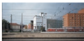
adambräu_BR.jpg Außenansicht Adambräu

Im Rahmen der Berichterstattung über das aut und unter Anführung des jeweiligen Bildnachweises dürfen die Aufnahmen honorarfrei abgedruckt werden.