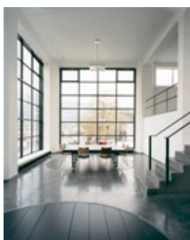
Innenansicht Adambräu