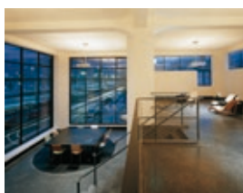
aut_Lounge_Wett.jpg Innenansicht Adambräu