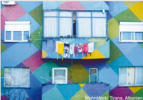
Wohnblock/ Tirana, Albanien